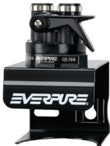
QL3BB Filterkopf: 4314-00